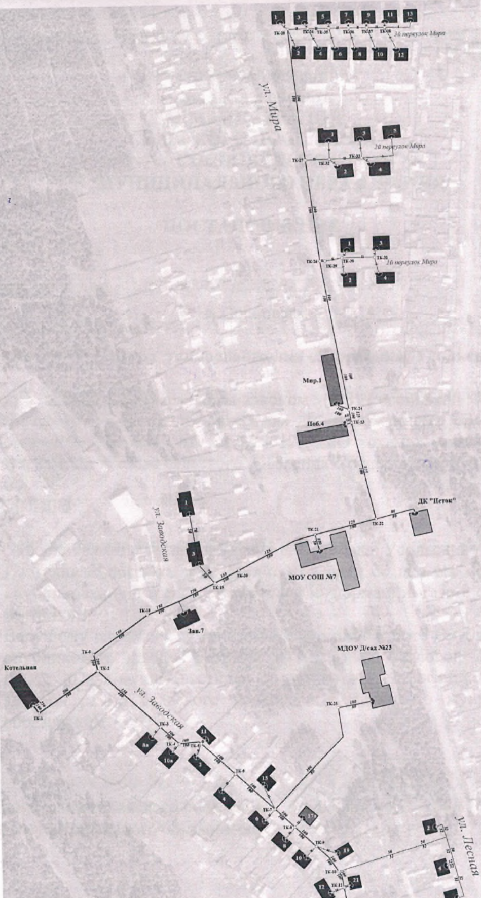
Схема теплоснабжения с. Сосновка